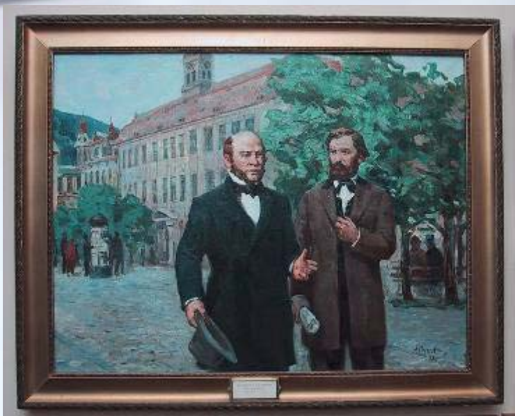
Н.И. Пирогов и К.Д. Ушинский в Гейдельберги.

«Слово и раннее обучение грамоте я считаю необходимым делом для культурного общества. Евреи, как древний, много испытавший народ, знают это по опыту; пятилетних детей они сажают за грамоту, да еще за какую, — не чета нашей, усваиваемой теперь по звуковому и другим новейшим способам».