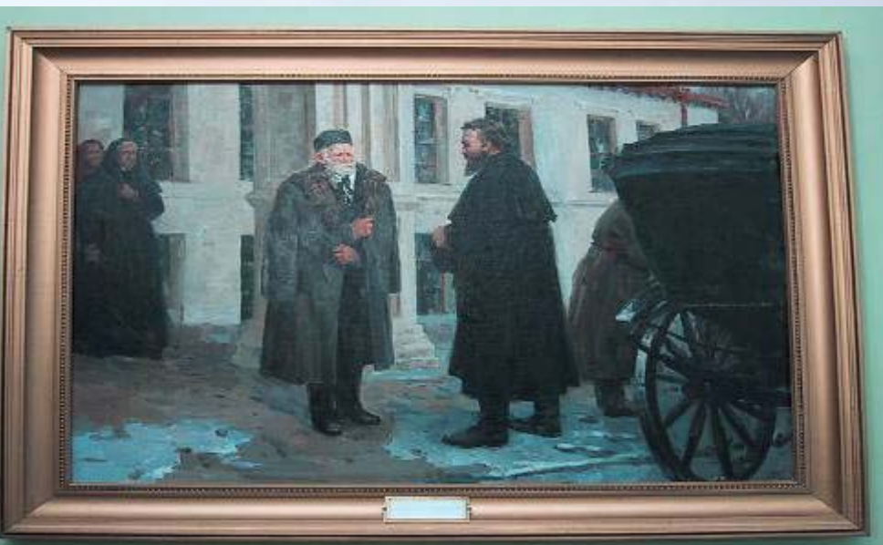
Приезд М.В. Склифосовского в усадьбу Вишня.