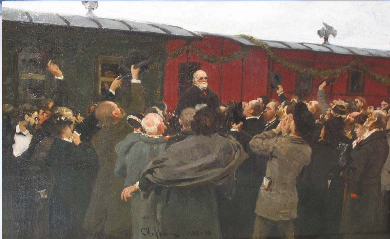
Приезд Николая Ивановича Пирогова в Москву на 50-летний юбилей его научной деятельности Худ. И.Е.Репин