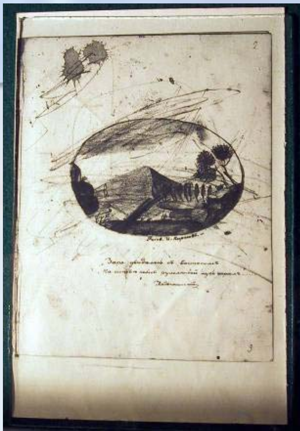
Первый труд 13-летнего Н.И. Пирогова (вторая страница)

Родители любили нас горячо; отец был отличный семьянин; я страстно любил мою мать и теперь еще помню, как я, любуясь ее темно-красным, цветом массака, платьем, ее чепцом и двумя локонами, висевшими из-под чепца, считал ее красавицею, с жаром целовал ее тонкие руки, вязавшие для меня чулки; сестры были гораздо старше меня и относились ко мне также с большою любовью; старший брат был на службе, средний, годами старше меня, жил со мною дружно.