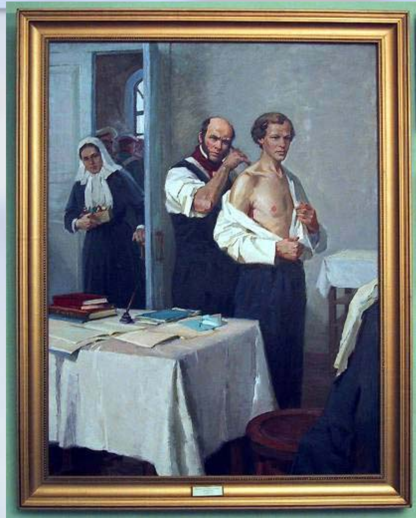
Н.И.Пирогов осматривает больного Менделеева.