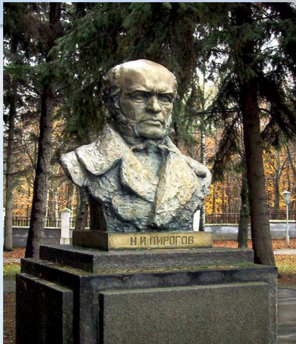
Памятник Н. И. Пирогову. Скульптор И. Крестовский