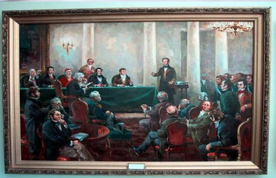
Защита Н.И.Пироговым докторской диссертации.