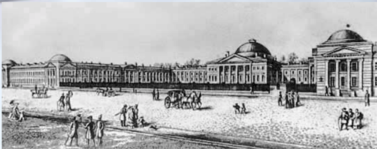
Петербургская медико-хирургическая академия. Гравюра начала XIX в

Из книги «Анатомически изображения внешнего вида и размещения органов»