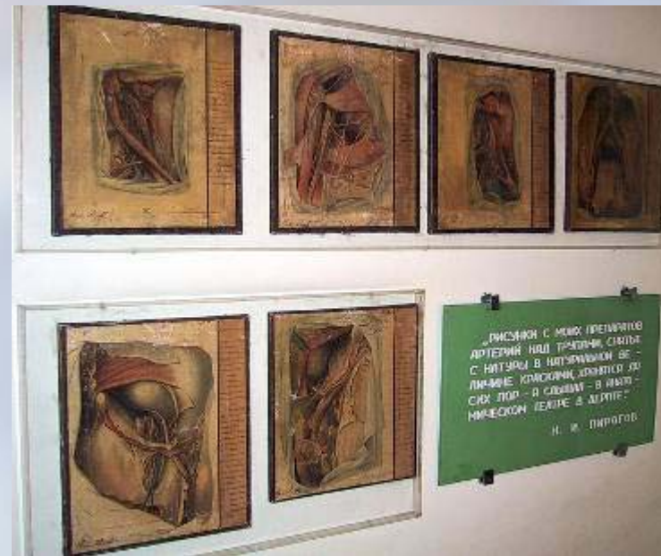
Серия рисунков к «Хирургической анатомии»

Тогда литографов в Петербурге был только один, и то незавидный. Первые опыты литографского искусства Шлатера и были рисунки моей «Хирургической анатомии». Они удались вполне.